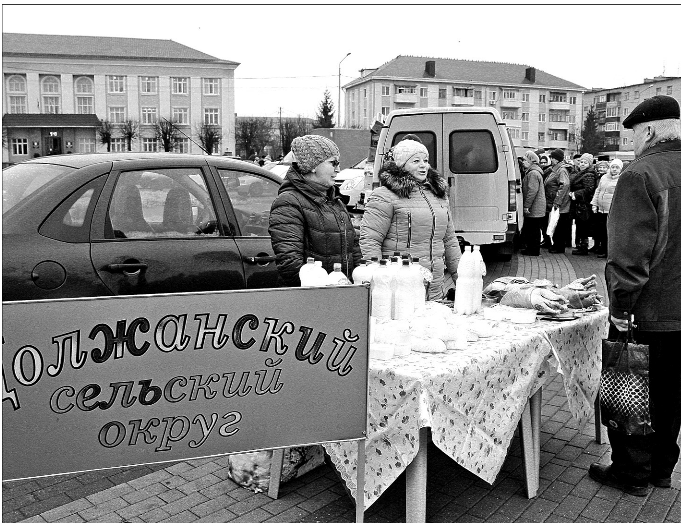
Предновогодняя ярмарка на центральной площади посёлка Вейделевка